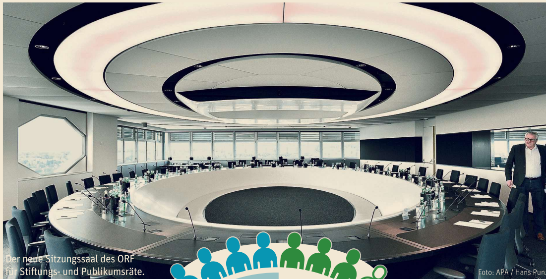
Der neue Sitzungssaal des ORF für Stiftungs- und Publikumsräte.