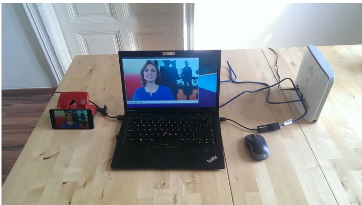
Abbildung 1) Aufbau der Messung

Der Laptop ist mit einer WLAN-Schnittstelle ausgestattet und wurde mittels der Software "hostapd" im Access-Point-Modus betrieben. In das vom Laptop bereitgestellte verschlüsselte WLAN-Netzwerk wurde ein Mobiltelefon des Typs Huawei ALE-L21 eingebucht. Auf dem Mobiltelefon war die Anwendung "3MobileTV" installiert. (Aufbau siehe Abbildung 1.)